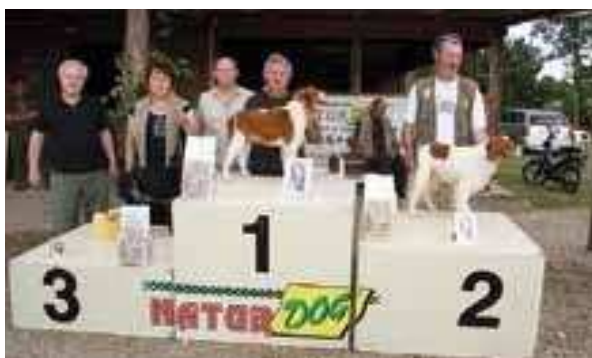
SIRÒ - E.B. di Pier Ugo Bettini

11. Nella gara finale del Trofeo Regionale "B.SASI" ci sarà anche il giudizio sulla morfologia del cane per questo ci sarà una classifica di Bellezza e la classifica di "Bravo e Bello" sommando i punteggi ottenuti sia in lavoro che in esposizione. Per tutto quanto non previsto dal presente Regolamento di Campionato vige il Regolamento Nazionale delle competizioni Cinotecniche Venatorie del C.S.A.A.