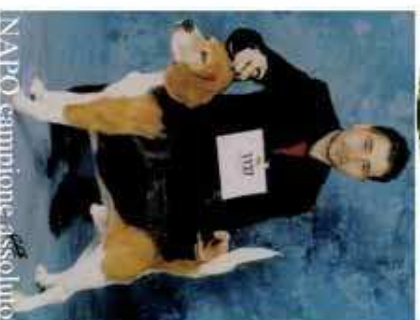
NAPOLI, campione assoluto

Via Voltella, 32 - 53048 Sinalunga (Siena) Tel. e Fax 0577 679518 mistermixdog@mistermixdog.com www.mistermixdog.com