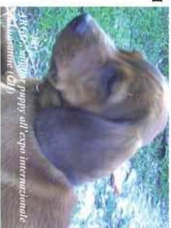
AKC's "miglior puppy" all'expo internazionale "Amsterdame (NL)

ALLEVAMENTO AMATORIALE "LA VALLE DEGLI OSCAR"