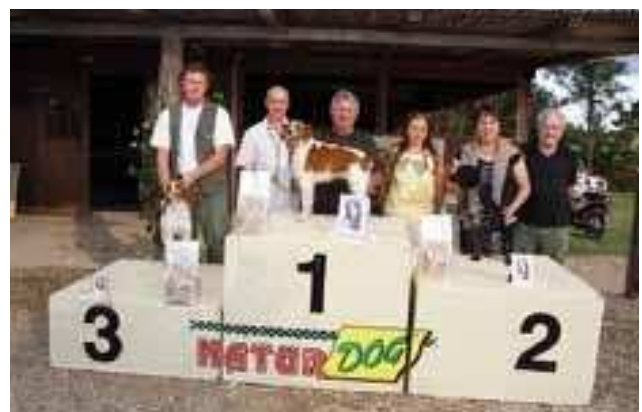
Classifica prova inglesi 1° ecc. TIM S.I. di Antonio D'Alise